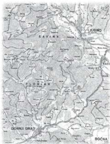
Zgornja Savinjska dolina

Skrova v že opisani obliki niso uporabljali, ampak so v glavnem kurili v "divnik" 18 ( divnek ). To je bila v glavno steno vdolbljena odprtina (kakih 70 centimetrov v kvadratu). Globina je bila različna, vendar najpogosteje do 40 centimetrov. Tudi ta