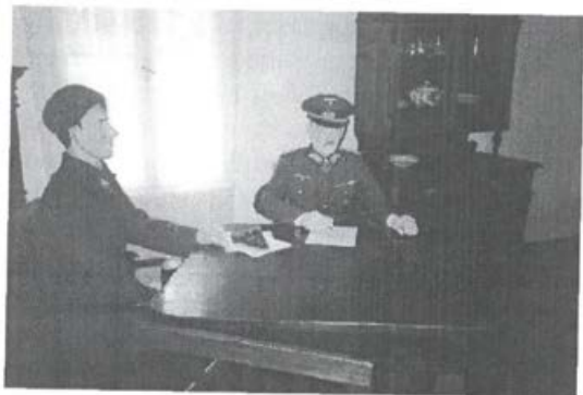
Nova spominska soba