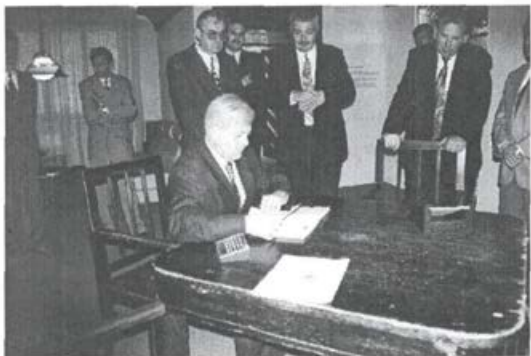
Obisk predsednika R Slovenije Milana Kučana