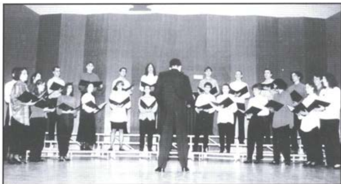
ŠŠKZ v elementu ...

smo poleg širših nalog in ciljev podali dva čisto konkretna predloga o skupnem delu.