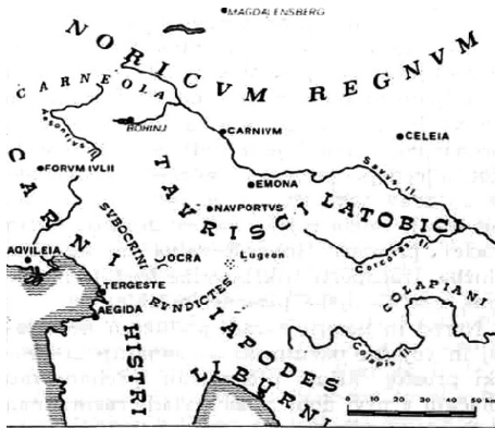
Poselitev Slovenije v keltski dobi

Ne delmatsko-panonski upor proti rimski nadoblasti (6—9 po n. e.), ne upor vojakov armade v Iliriku, ko so zvedeli za smrt vladarja Avgusta (l. 14 po n. e.), nista hudo udarila prebivalstva. Niti v letu ‚štirih vladarjev‘ (69), ko so se na sestanku v Poetovionu poveljniki v Iliriku stacioniranih legij odločili vojaško podpreti kot kandidata za prestol uglednega generala, zmagovalca upornih Judejcev, T. Flavija Vespazijana (69—79), dežela ni prehudo trpela. Seveda pa je vse to — kot pozneje tudi Domicijanove (85—89) in Trajanove borbe z Dačani (101 do 106) — od daleč odmevalo, kolikor se delno ni celo tu dogajalo. Drugače je bilo ob krvavem vdoru germanskih plemen pod vodstvom Markomanov, ki so privihrali v Slovenijo do Furlanije (verjetno leta 167), zlasti ker je hkrati izbruhnila kužna epidemija. Ti udarci so razredčili prebivalstvo, uničili gospodarstvo in vladar Mark Avrelij (161—180) je moral tedaj sam prevzeti vrhovno poveljstvo.